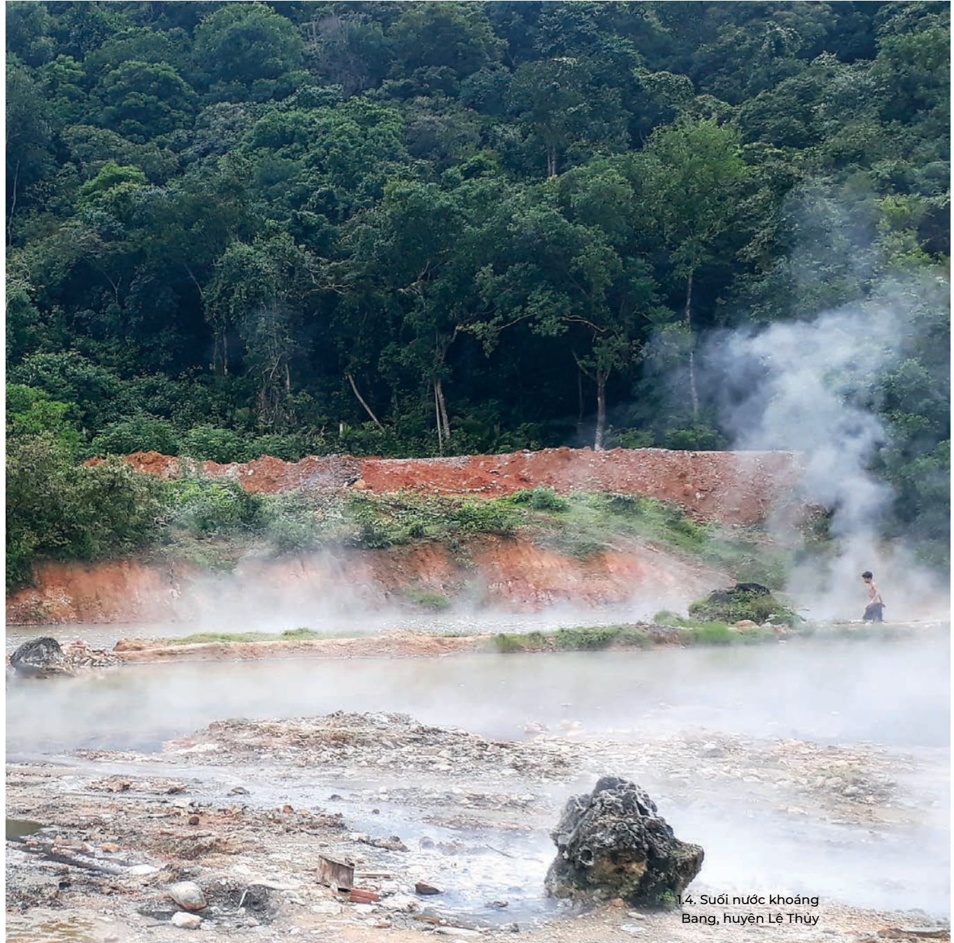
1.4. Suối nước khoáng Bang, huyện Lệ Thủy