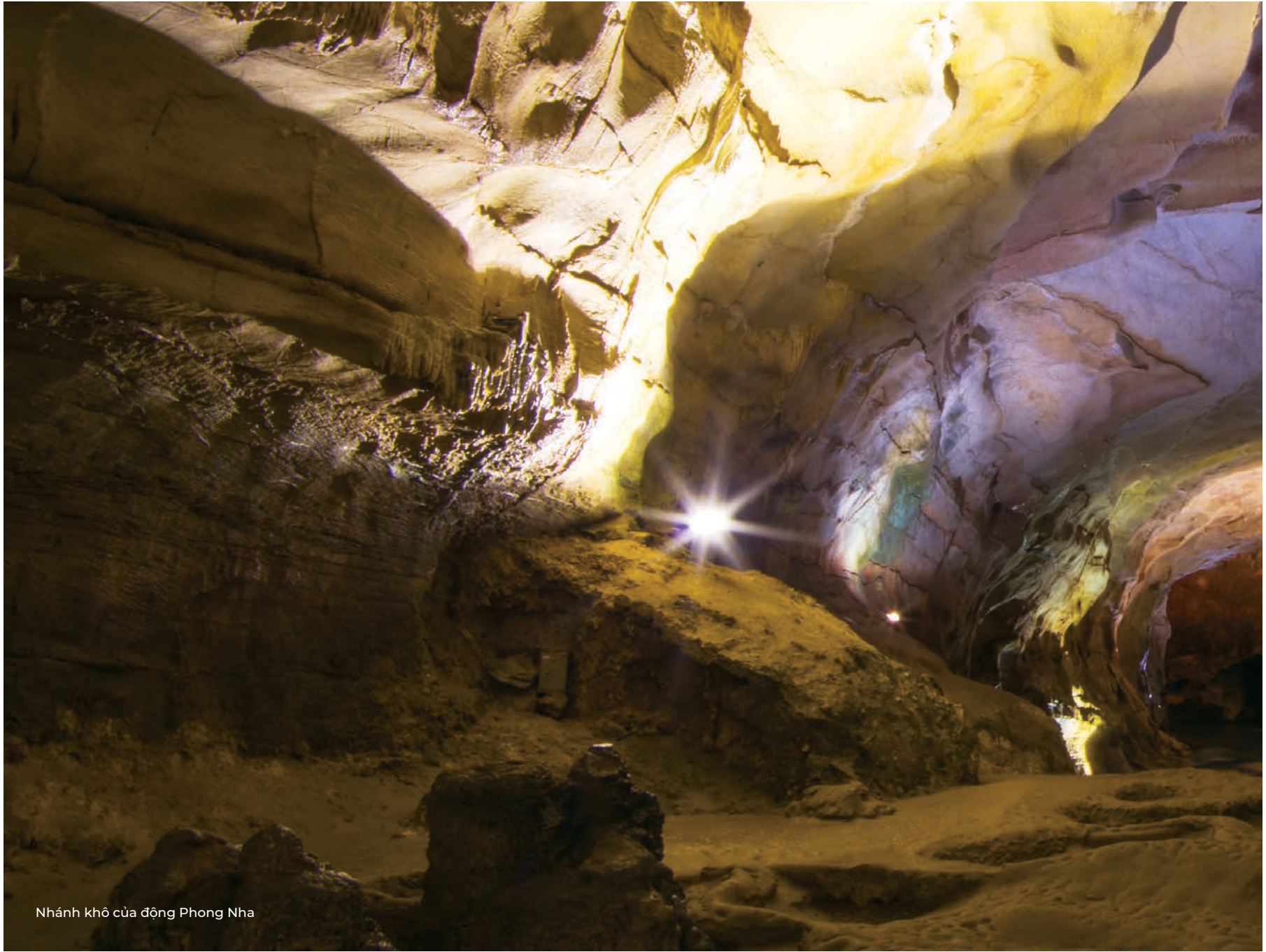
Nhánh khô của động Phong Nha