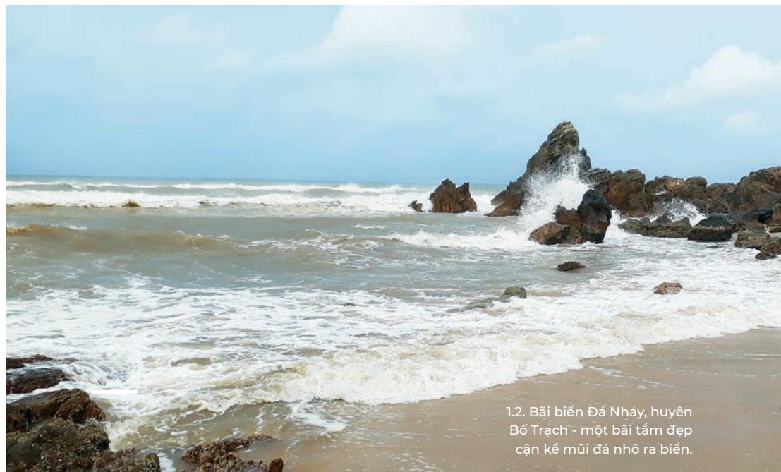
1.2. Bãi biển Đá Nhảy, huyện Bố Trạch - một bãi tắm đẹp cận kề mũi đá nhô ra biển.

Tỉnh Quảng Bình có nhiều khoáng sản quý như: vàng, sắt, titan, đá vôi, cao lanh, thạch anh. Trong đó, đá vôi và cao lanh có trữ lượng lớn, đủ điều kiện để phát triển công nghiệp xi măng và vật liệu xây dựng với quy mô lớn. Ngoài ra, trên địa bàn tỉnh có 3 mỏ nước suối khoáng, trong đó suối nước khoáng nóng Bang ở huyện Lệ Thủy có điểm sôi 105°C, có tác dụng chữa bệnh (hình 1.4).