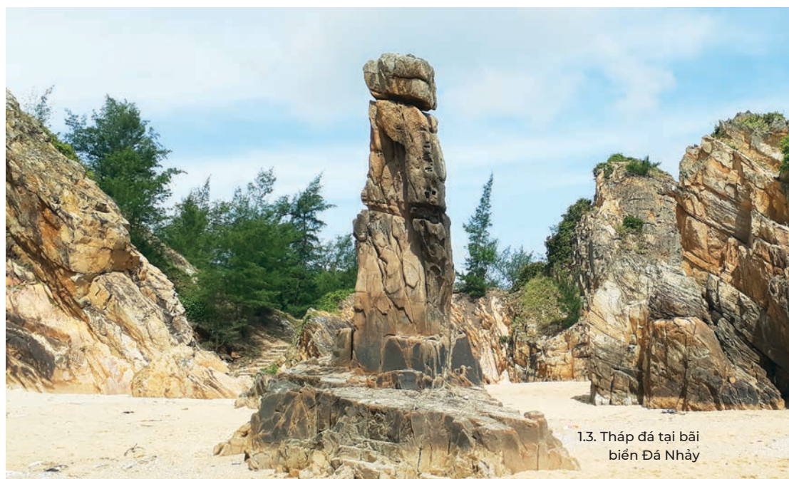
1.3. Tháp đá tại bãi biển Đá Nhảy