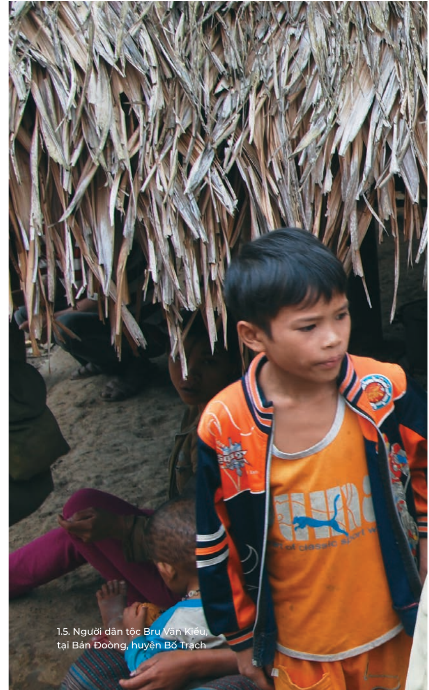
1.5. Người dân tộc Bru Vân Kiều, tại Bản Đòng, huyện Bố Trạch