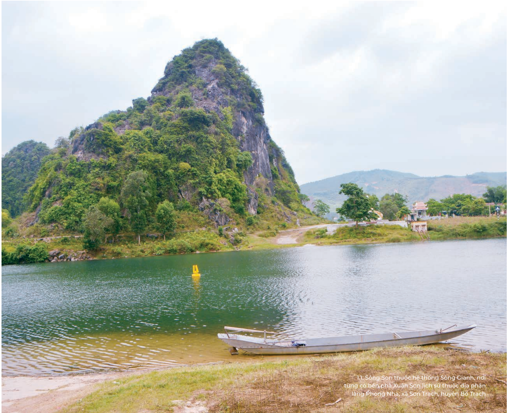
1.1. Sông Sơn thuộc hệ thống Sông Gianh, nơi từng có bến phà Xuân Sơn lịch sử thuộc địa phận làng Phong Nha, xã Sơn Trạch, huyện Bố Trạch