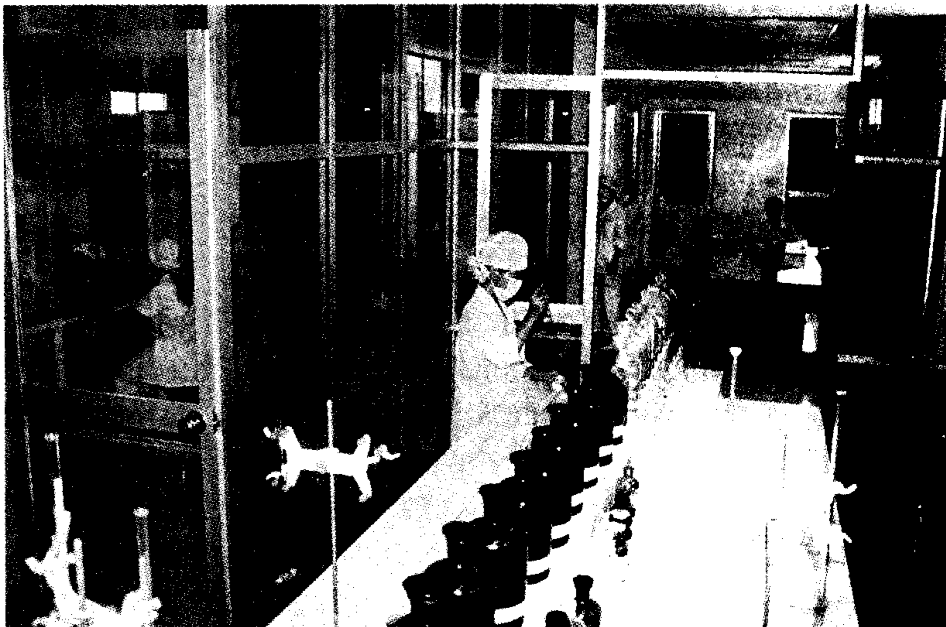
Quy trình kiểm tra thuốc của Công ty

Trong không khí cả nước đang dấy lên phong trào “người Việt dùng hàng Việt”, ngành y tế không nằm ngoài xu thế đó. Đã từ lâu, trong lĩnh vực dược phẩm, tâm lý sính thuốc ngoại vẫn còn đè nặng trong ý thức của người tiêu dùng Việt. Điều đó có nhiều nguyên nhân song có lẽ ý thức của người tiêu dùng và việc kê đơn thuốc ngoại của một bộ phận không nhỏ các thầy thuốc là