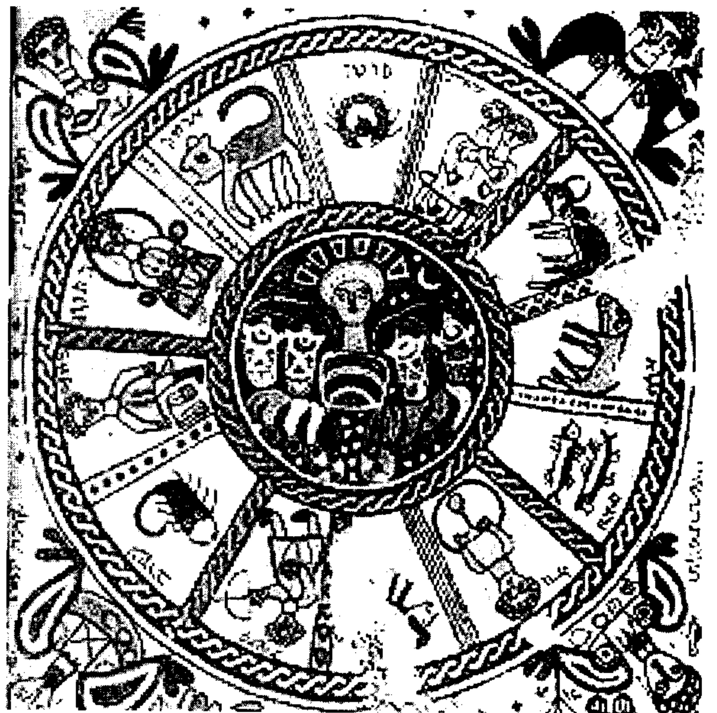
Hình vẽ về 12 chòm sao chiếu mệnh của người Do Thái thế kỉ thứ VI

toán, chiêm bôc, tiên đoán tương lai luôn tương tượng như các nhà thần bí thời xưa gọi mây hô gió. CTH là luận thuyết giải đoán và dự báo số phận con người, vận mệnh của quốc gia, dân tộc thông qua mối liên hệ giữa vị trí các thiên thể với các sự kiện lịch sử, với số phận con người.