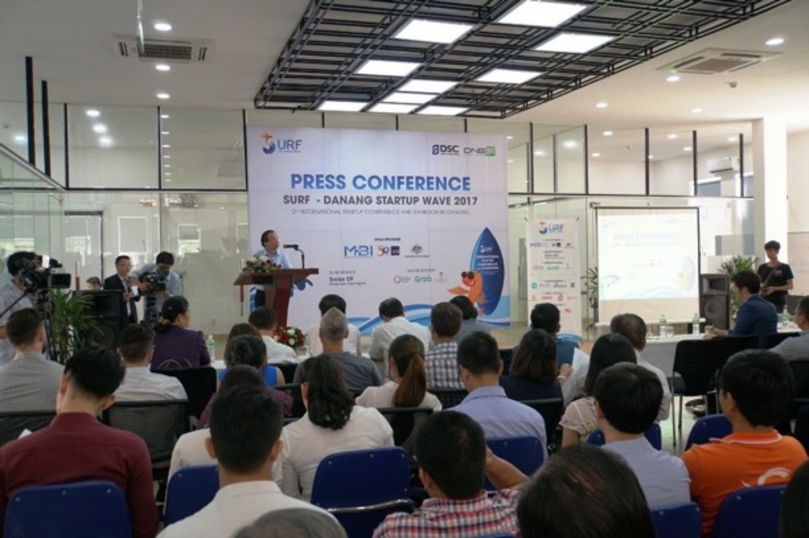
Một hoạt động về khởi nghiệp thu hút bạn trẻ trong năm 2017 tại Đà Nẵng

2020, Đà Nẵng sẽ tập trung phát triển hệ sinh thái khởi nghiệp đổi mới sáng tạo với các ưu tiên gồm: Xây dựng văn hoá khởi nghiệp; hoàn thiện và ban hành các cơ chế, chính sách hỗ trợ, thúc đẩy khởi nghiệp và tái khởi nghiệp; đẩy mạnh hoạt động của các vườn ươm doanh nghiệp; xây dựng và phát triển mạng lưới đào tạo khởi nghiệp và đổi mới sáng tạo nhằm tăng cường kiến thức và kỹ năng khởi nghiệp cho thanh niên, sinh viên đam mê khởi nghiệp; mở rộng hợp tác, liên kết nâng cao năng lực, thu hút các nguồn lực trong và ngoài nước xây dựng và phát triển hệ sinh thái khởi nghiệp; nhân rộng mô hình hợp tác 3 bên: Chính quyền, trường học và doanh nghiệp.