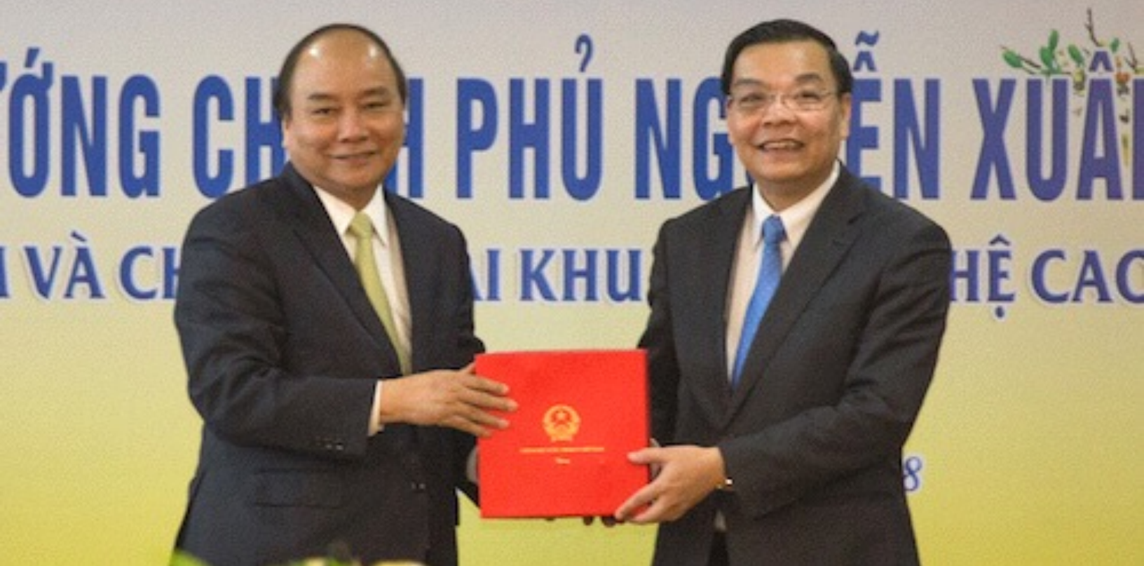
Thủ tướng trao quà kỷ niệm cho Bộ trưởng Bộ Khoa học và Công nghệ Chu Ngọc Anh