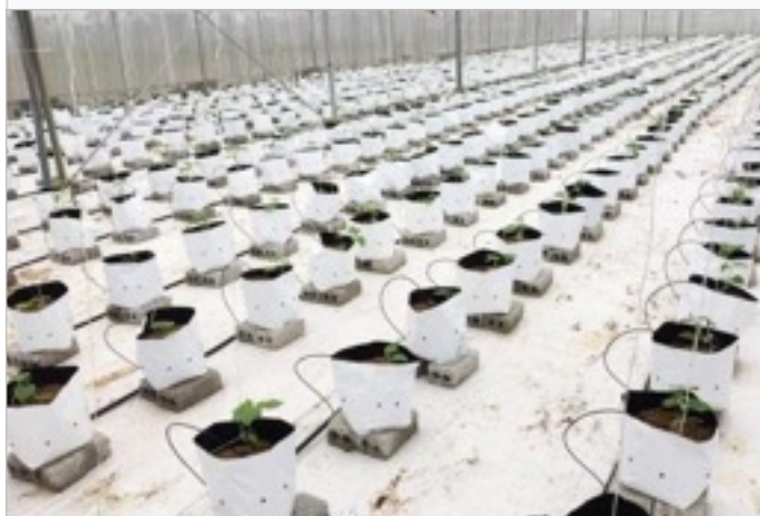
TRANG TRẠI THỦY CANH ĐÈN LED LIÊN HỆ: 0982444684