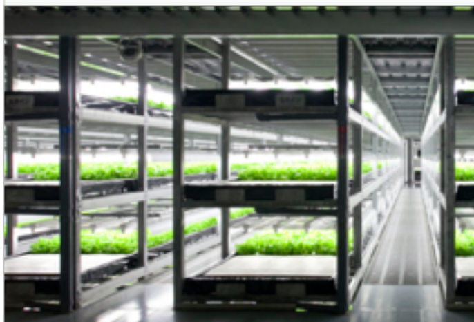
TRANG TRẠI TƯỚI NHỎ GIỌT LIÊN HỆ: 090.123.6086